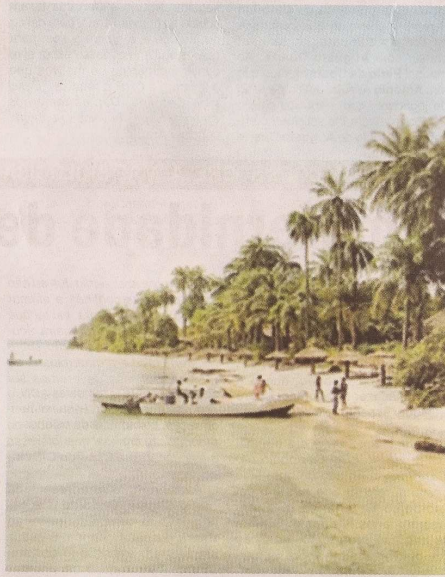
O arquipélago dos Bijagós está referenciado como uma das principais e seguras portas de entrada da droga desembarcada pelos cartéis colombianos na Guiné-Bissau