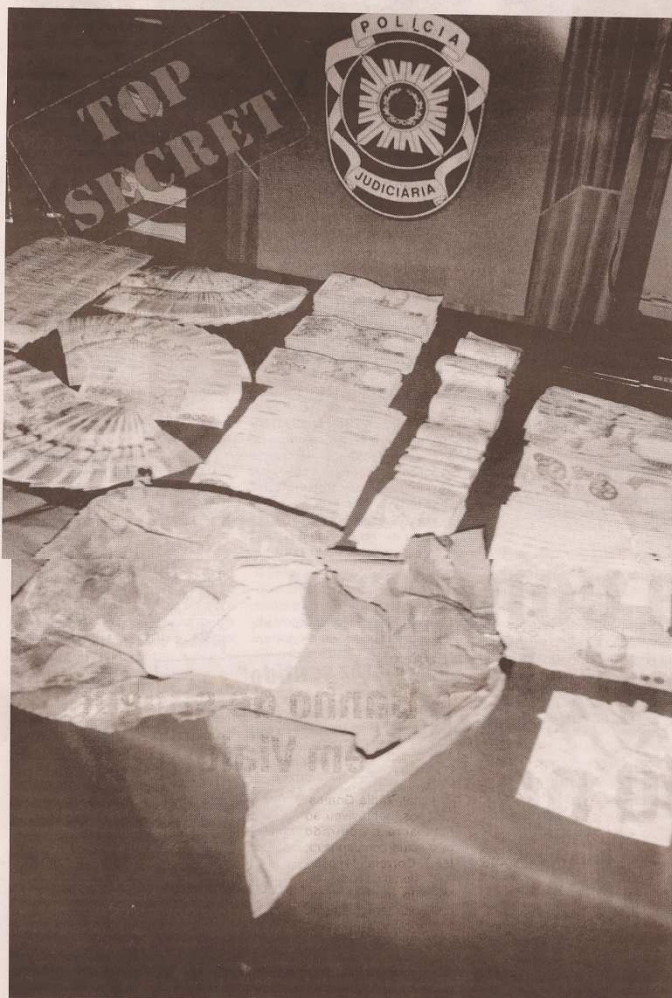
Relatórios da DCITE da PJ alertando as nossas «secretas» para a crescente implantação dos narcotraficantes colombianos na Guiné-Bissau foram «metidos na gaveta»

V ASTA documentação foi objecto de relatórios, da antiga DCITE (PJ) alertando para o banho de sangue entre as principais facções beligerantes que lutavam pelo controlo do tráfico na Guiné-Bissau, a principal fonte de riqueza de uma elite corrupta e que ia «engordando» num país cada vez mais paupérrimo, sustentada, dizem