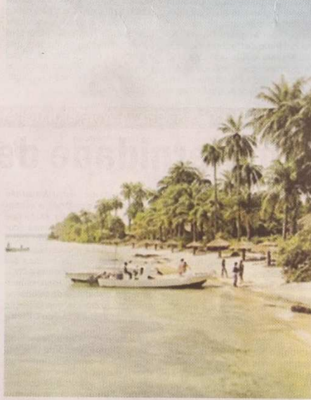
O arquipélago dos Bijagós está referenciado como uma das principais e seguras portas de entrada da droga desembarcada pelos cartéis colombianos na Guiné-Bissau